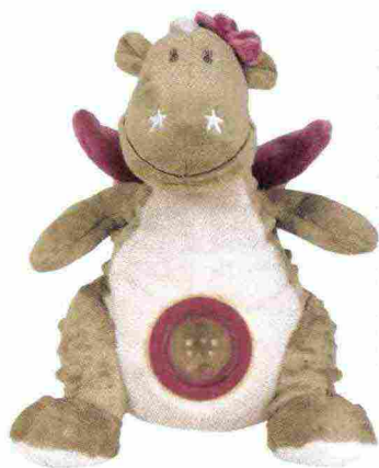
Sonaglio Dolce Draghetta linea Victoria&Lucie Noukie's € 23,90